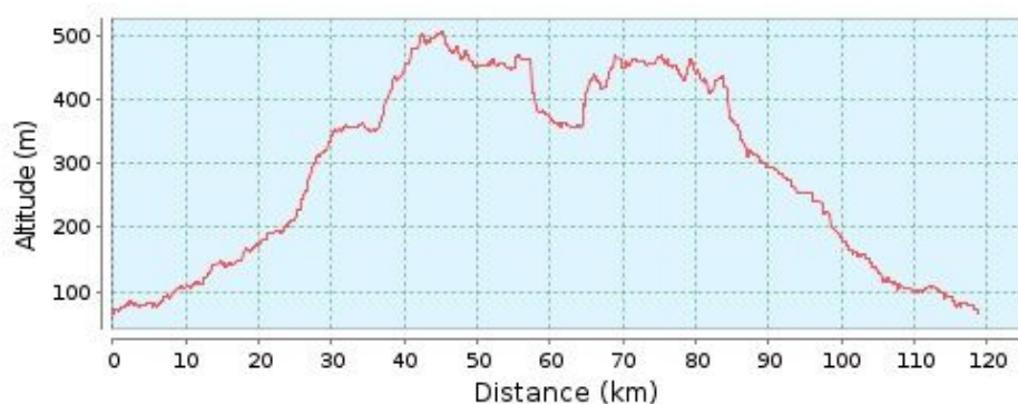
Profilo altimetrico (65 m a 505 m)