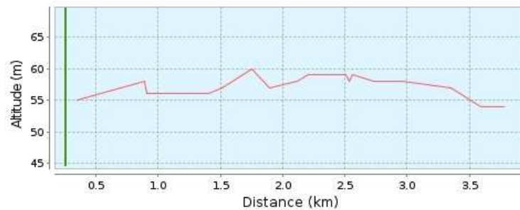
Profilo altimetrico (54 m a 60 m) Altezza: 58 m @ 0.2 km